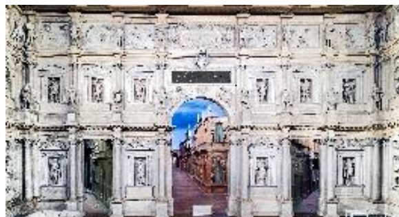
Театр Олимпико в городе Виченце