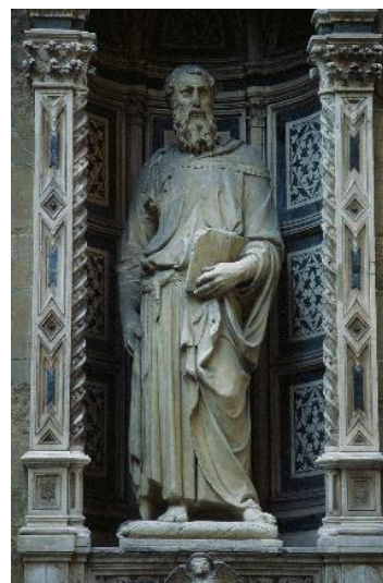
4. Донателло. Святой Марк. 1411–1413