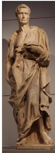
7. Донателло. Пророк Иеремия. 1423–1426