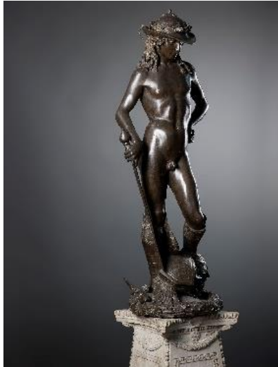
5. Донателло. Давид. ок 1440