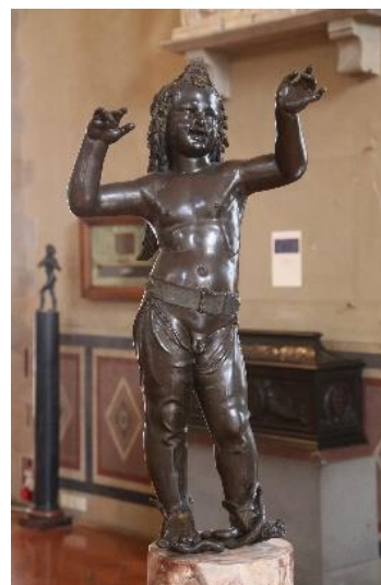
2. Донателло. Амур-Атис. 1430-е