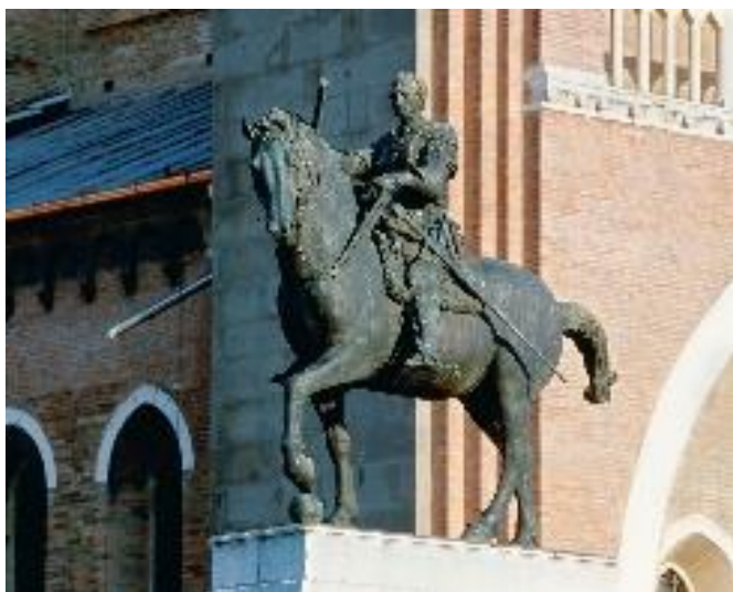
1. Донателло. Памятник Гаттамелате. 1453

Перед Вами ряд работ знаменитого флорентийского скульптора конца XIV – начала XV века Донателло. Это статуи, выполненные по светским и церковным заказам и предназначенные для очень разных пространств: они украшали палаццо, кампанилу, стояли на площадях, находились в интерьере храмов. Во всех них чувствуется опора на античные образцы, глубокое осмысление скульптором принципов древнегреческого и древнеримского построения круглой формы. Внимательно посмотрите на статуи, собранные в задании.