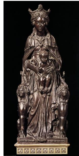
8. Донателло. Мадонна с младенцем. Фрагмент алтарной композиции из собора Св. Антония в Падуе. 1447–1450