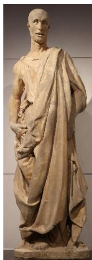
3. Донателло. Пророк Аввакум (Цукконе). 1423–1425