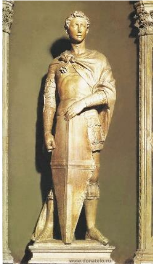
9. Донателло. Святой Георгий. 1415–1417

1. В каких скульптурах Донателло подчёркнуто использует древнегреческий хиазм?