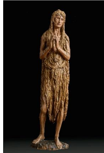
6. Донателло. Кающаяся Мария Магдалина. 1453–1455